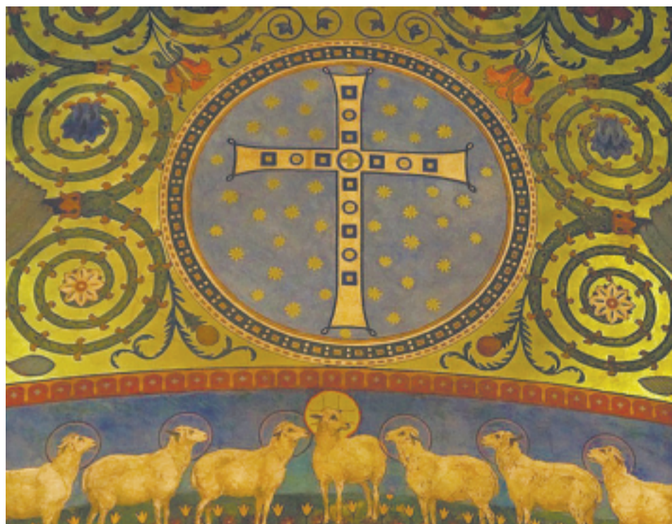
Виктор Васнецов. Фреска, XIX век.

В Церкви подробно разработано учение о восьми основных страстях. Вот их