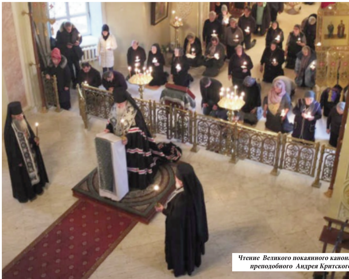
Чтение Великого покаянного канона преподобного Андрея Критского